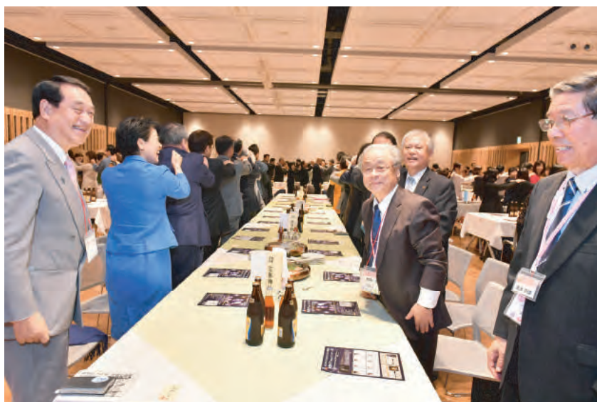
和やかに始めました