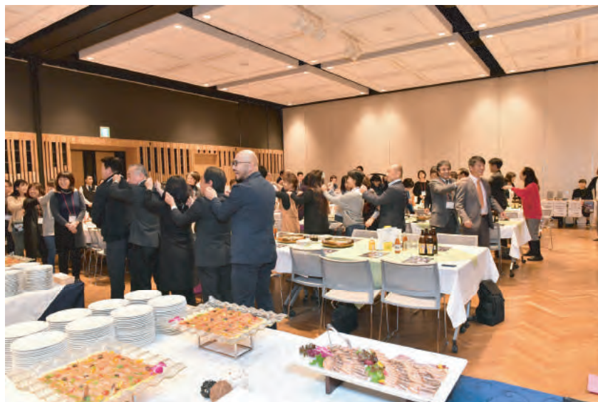
川副副会長の挨拶の中で 「つながろう！」