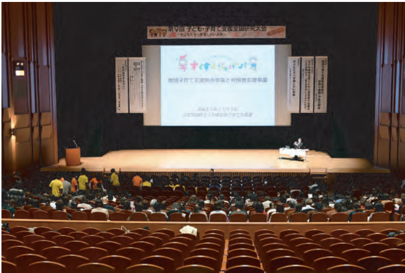
厚生労働省 子ども家庭局 子育て支援課 課長 田村悟氏