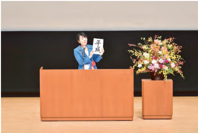
パネラー 参議院議員／ 元少子化対策担当大臣／ 初代女性活躍担当大臣 有村治子氏