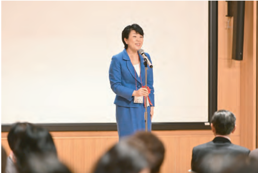
来賓挨拶 参議院議員 有村治子氏