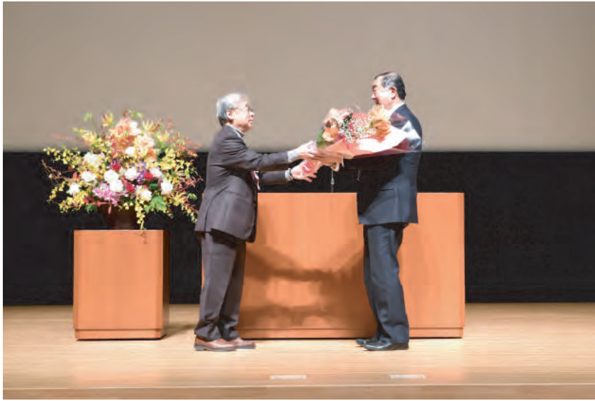
次回開催県へ花束贈呈