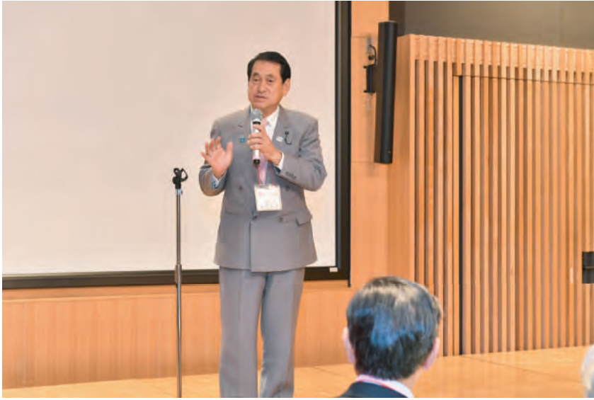
来賓挨拶 埼玉県議会議員 議長 齋藤正明氏