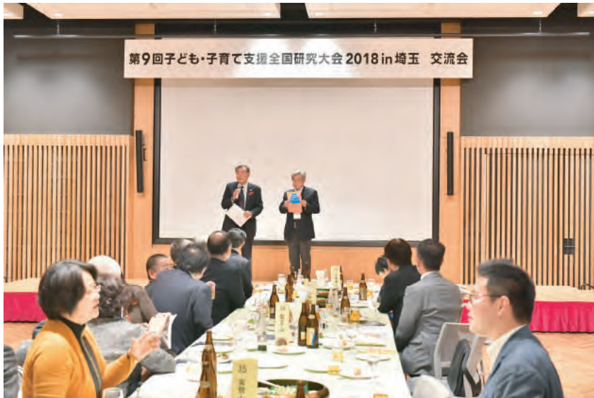
次回開催県 山梨によるご案内