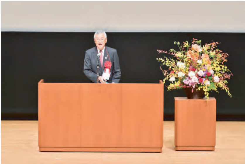
来賓挨拶 川越市長 川合善明氏