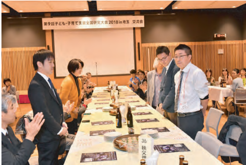
ご臨席賜った講師の皆様のご紹介