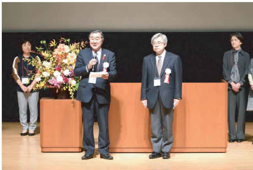
次回開催県の挨拶