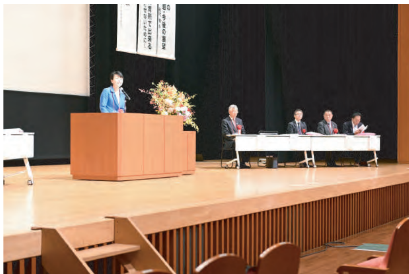
来賓挨拶 参議院議員 有村治子氏